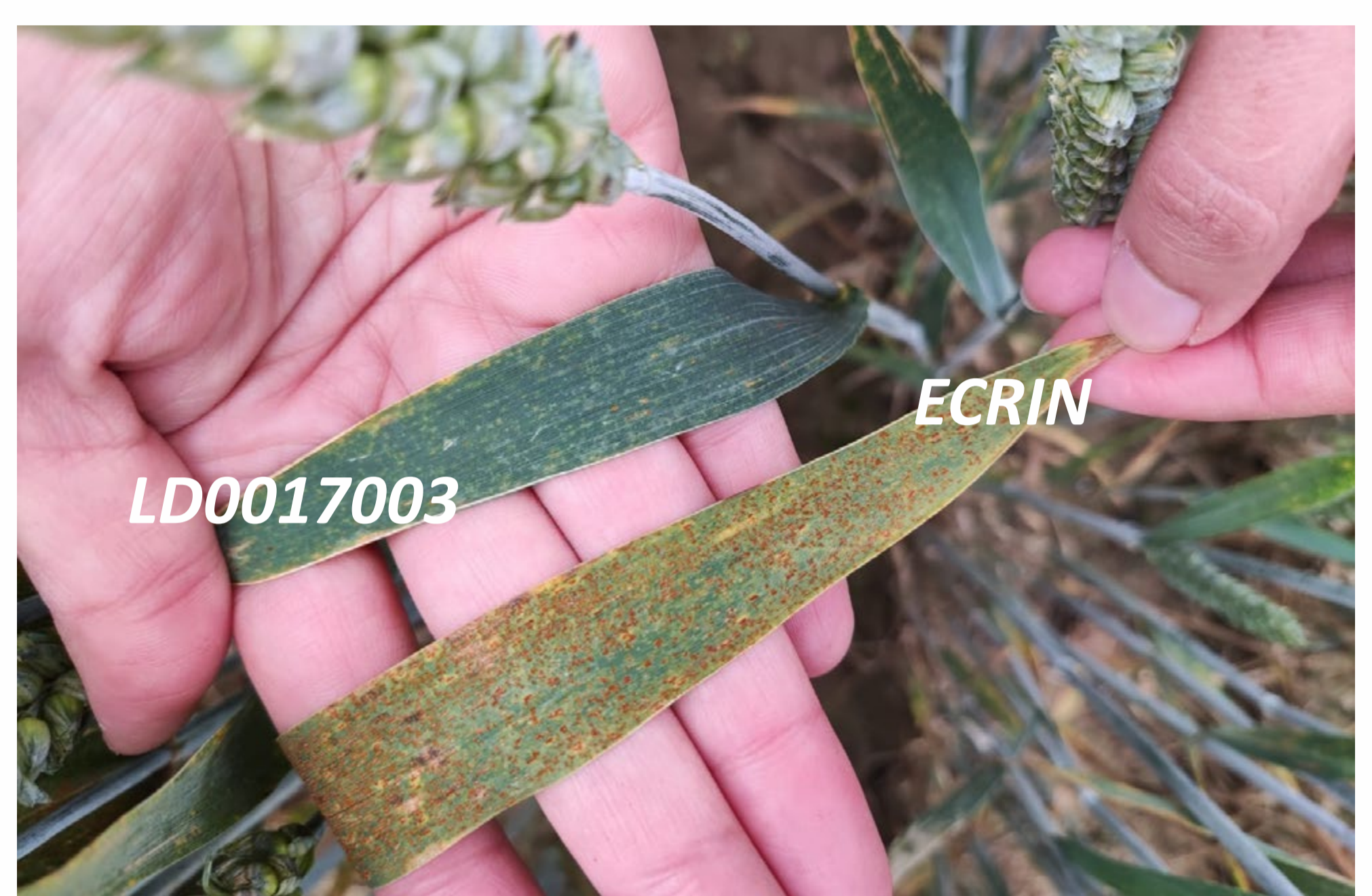
Figure 1. Feuilles des variétés sensible ECRIN et partiellement résistance LD0017003 après inoculation avec la souche de P. triticina BT06M140

Le champignon basidiomycète Puccinia triticina Erikss est responsable de la rouille brune sur le blé tendre, le blé dur et le triticale. L'objectif du projet MaBrune est d'identifier des marqueurs moléculaires diagnostiques de la présence de gènes Lr et de QTL de résistance à cette maladie. A ce jour, 80 gènes Lr ont été identifiés dans le blé, dont la plupart sont impliqués dans des interactions gène-pour-gène avec les isolats de rouille brune; mais seulement certains de ces gènes Lr ont été postulés dans les variétés de blé tendre françaises. Dans un projet FSOV précédent, 15 QTL de résistance ont été identifiés pour expliquer la résistance partielle de 6 variétés de blé tendre (Apache, Tremie, Sideral, LD0017003, PBI04006, Renan; Figure 1).